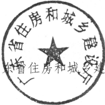
广东省住房和城乡建设厅