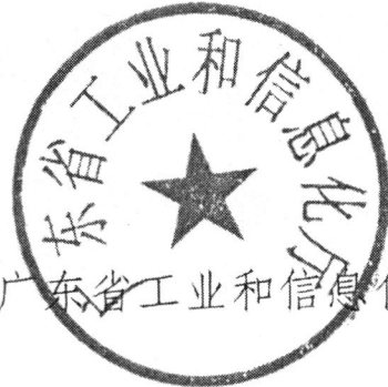
广东省工业和信息化厅