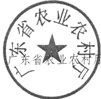
广东省农业农村厅