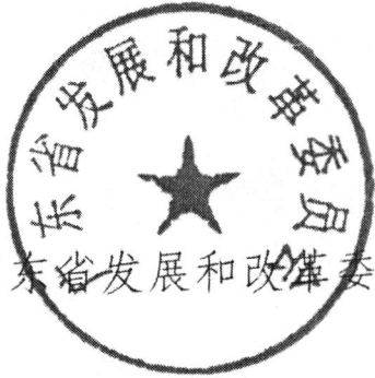
广东省发展和改革委员会