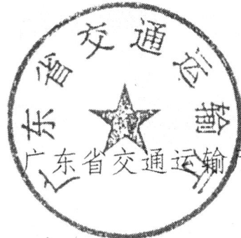
广东省交通运输厅